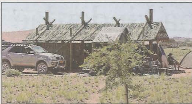
Só lyk een van die 12 staanplekke op die nuwe kampeertrein. Elkeen het sy eie dak, vloer, toilet, stort en wasbak.