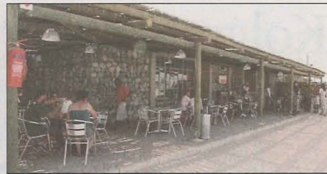
Daar is ook 'n nuwe eetplek naby Sossusvlei. As jy iets by die huis vergeet het, is daar boonop 'n winkel wat tot jou redding kan kom in die woestyn.